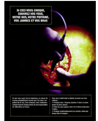
Visuel de la campagne australienne (traduit en français).

une campagne concernant un autre sujet (groupe témoin). Les participants ont été interrogés avant et après avoir vu les supports d'information. Les résultats de cette enquête permettront à l'Inpes d'optimiser les prochains dispositifs de communication sur le sujet. ■