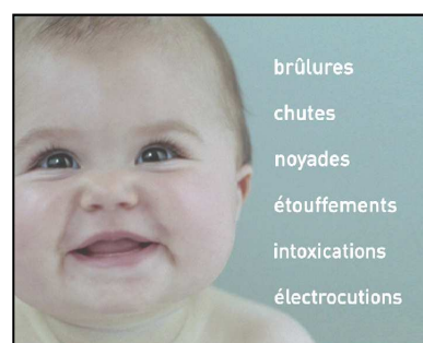
Spot « Chute »

Une première partie illustre le risque concerné, laissant le spectateur penser que l'accident s'est effectivement produit. En fait, le film nous révèle qu'il n'en est rien : l'enfant est sain et sauf grâce à l'adulte qui a eu le bon réflexe pour éviter ce risque.