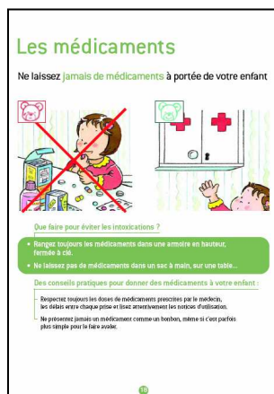
Une page intérieure type