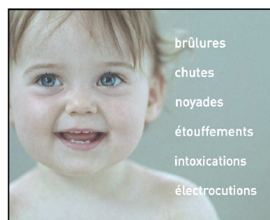
Spot « Noyade »

Traduisant une volonté de responsabilisation des adultes, ces spots rappellent la réalité des risques tout en montrant les réflexes simples pour les éviter. Le choix de trois catégories de risques s'inscrit dans une logique globale de prévention des accidents domestiques. A la fin de chacun d'eux est rappelé le fait que tous les jours, « 2000 enfants sont victimes d'accidents de la vie courante ». Tandis que s'ajoutent, parallèlement, en surimpression les six catégories majeures de risques d'accidents domestiques (brûlures, chutes, noyades, étouffements, intoxications, électrocutions).