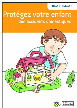
La couverture de la brochure

Cette brochure indique les réflexes simples et les gestes faciles à adopter pour éviter les accidents les plus fréquents à la maison. Elle est simple et compréhensible par tous. Les situations à risque et les bons réflexes sont illustrés par des dessins, auxquels s'ajoutent un certain nombre de conseils faciles à mettre en pratique au quotidien pour éviter les accidents.